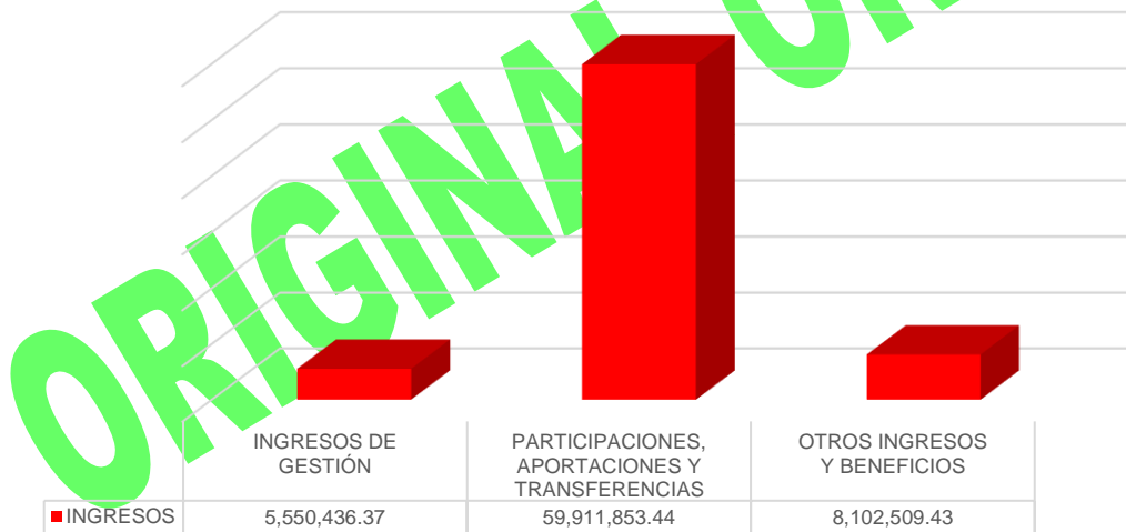
Gráfico 1. Ingresos